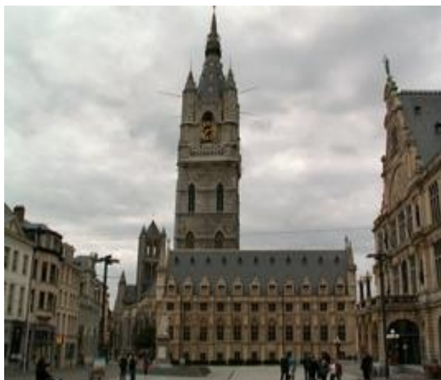
1339-E Gent (België).