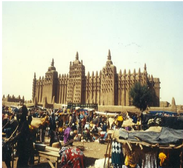
1340-W Djenne (Mali).