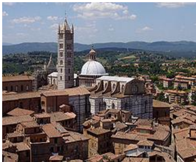
1325-E Siena (Italië).