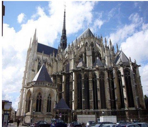
1269-E Amiens (Frankrijk).