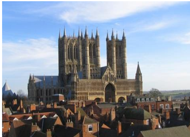
1280-E Lincoln (Engeland).