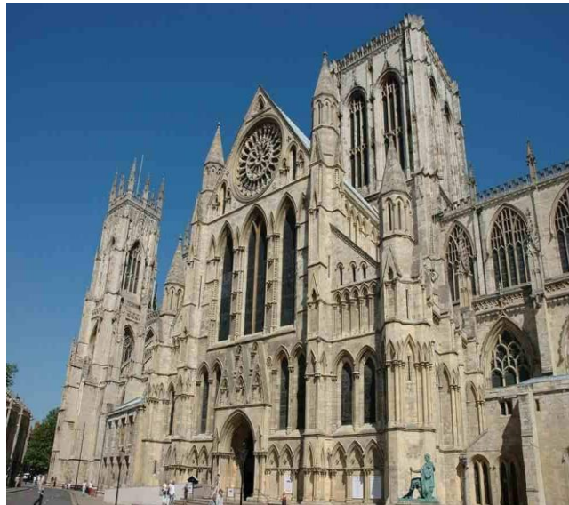
1133-E Durham (Engeland).

1131-N In Utrecht worden gebouwen in de as gelegd.