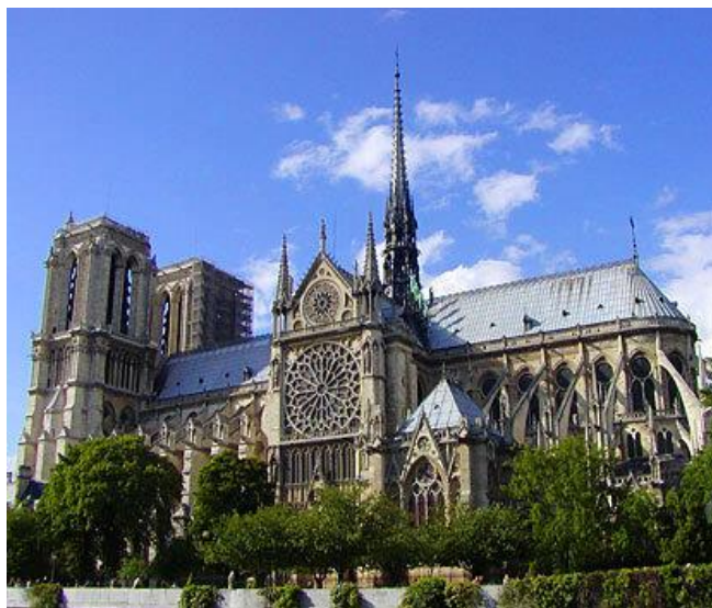
1345-E Parijs. Bouw gestart in 1163...