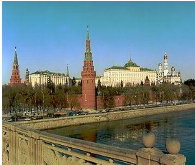
1339-E Moskou (Rusland).