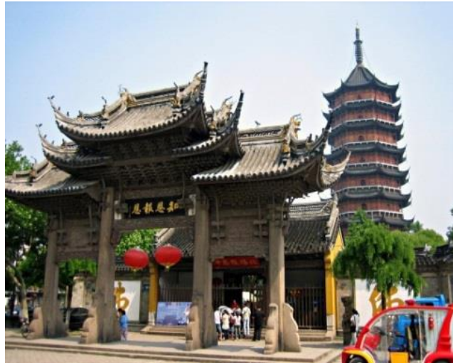
1131-W Suzhou (China).

1131-N In Utrecht worden gebouwen in de as gelegd.