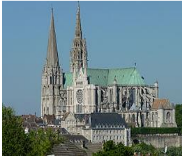
1260-E Chartres (Frankrijk).