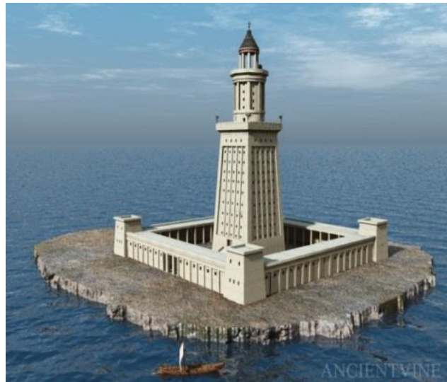
1323-W Alexandrië (Egypte).